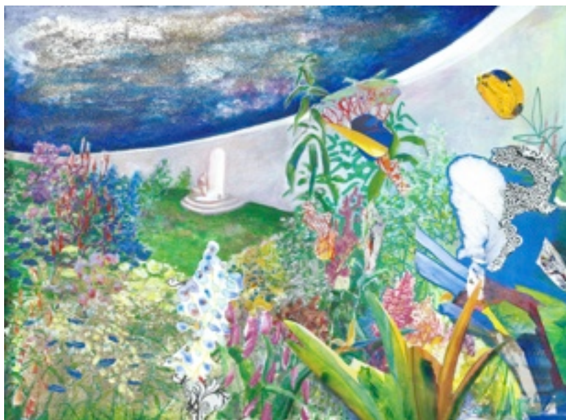
La frontière (Acrylique sur papier, 40 x 30 cm)

jaspe, et la ville était d'or pur, semblable à du verre pur. Les fondements de la muraille de la ville étaient ornés de pierres précieuses de toute espèce (...) Je ne vis point de temple dans la ville; car le Seigneur Dieu tout-puissant est son temple, ainsi que l'agneau. La ville n'a besoin ni du soleil ni de la lune pour l'éclairer; car la gloire de Dieu l'éclaire, et l'agneau est son flambeau. Les nations marcheront à sa lumière, et les rois de la terre y apporteront leur gloire. Ses portes ne se fermeront point le jour, car là il n'y aura point de nuit. On y apportera la gloire et l'honneur des nations. Il n'entrera chez elle rien de souillé, ni personne qui se livre à l'abomination et au mensonge; il n'entrera que ceux qui sont écrits dans le livre de vie de l'agneau.