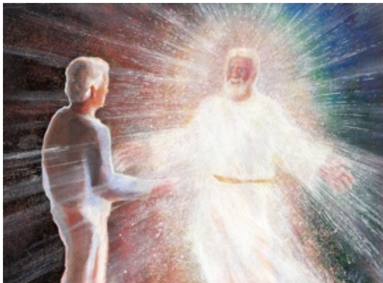
L'être de lumière (Acrylique sur papier, 30 x 21 cm)