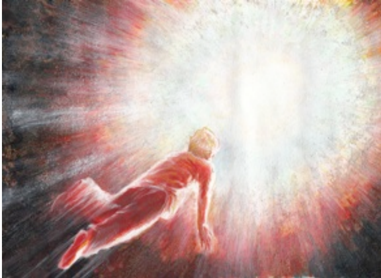
Vers la lumière (Acrylique sur papier, 30 x 21 cm)

et grâce pour grâce; car la loi a été donnée par Moïse, la grâce et la vérité sont venues par Jésus-Christ. Personne n'a jamais vu Dieu; le Fils unique, qui est dans le sein du Père, est celui qui l'a fait connaître.