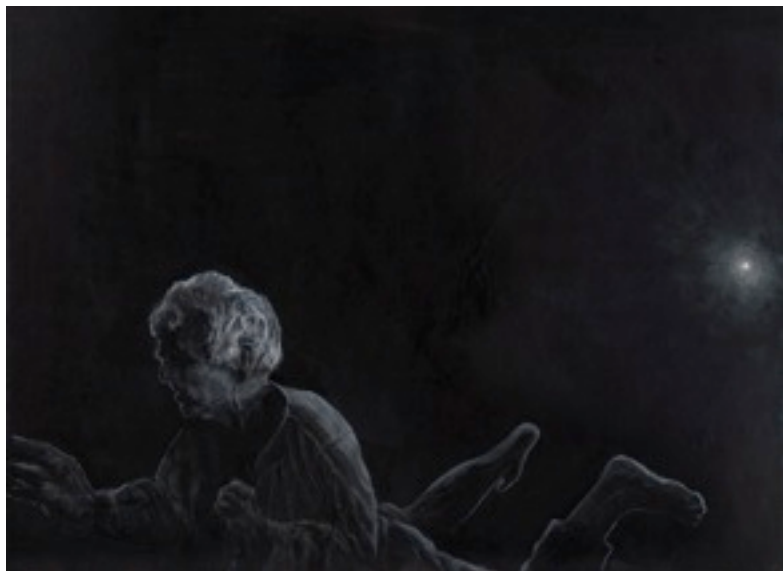
La pointe de lumière (Acrylique sur papier, 21 x 15 cm)

soient rendues à Dieu, qui nous donne la victoire par notre Seigneur Jésus-Christ !»