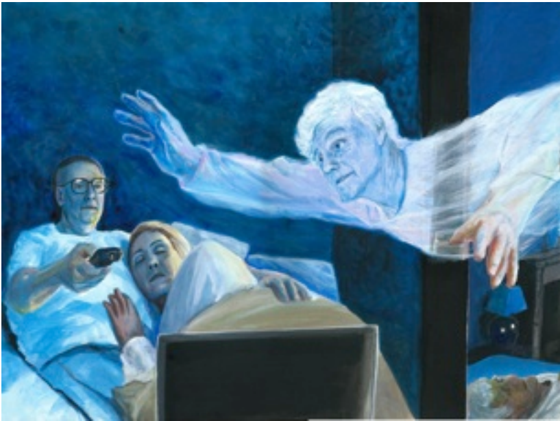
Ubiquité (Acrylique sur papier, 30 x 40 cm)

plus dans leur corps spirituel. Les aveugles voient, les sourds entendent; ceux qui avaient un membre coupé ont tous leurs membres. Ils se sentent bien et veulent parfois le communiquer avec ceux qui se trouvent dans la pièce. Mais ils réalisent rapidement que c'est impossible, qu'ils sont invisibles et qu'on ne les entend pas. Si le défunt pense à quelqu'un il se trouve instantanément dans sa proximité, quel que soit le lieu géographique. Il peut traverser les murs, les corps et les océans. S'il pense à un lieu il s'y rend en un clin d'oeil.