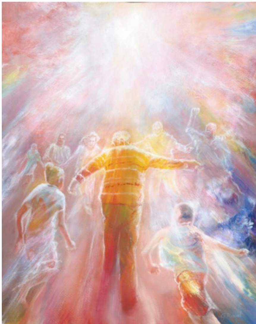
Retrouvailles (Acrylique et alkyde sur papier, 40 x 50 cm)

sujet. L'Ancien testament interdit formellement la nécromancie, ce qui signifie aussi que le dialogue avec des morts est possible. Cette pratique est dangereuse,