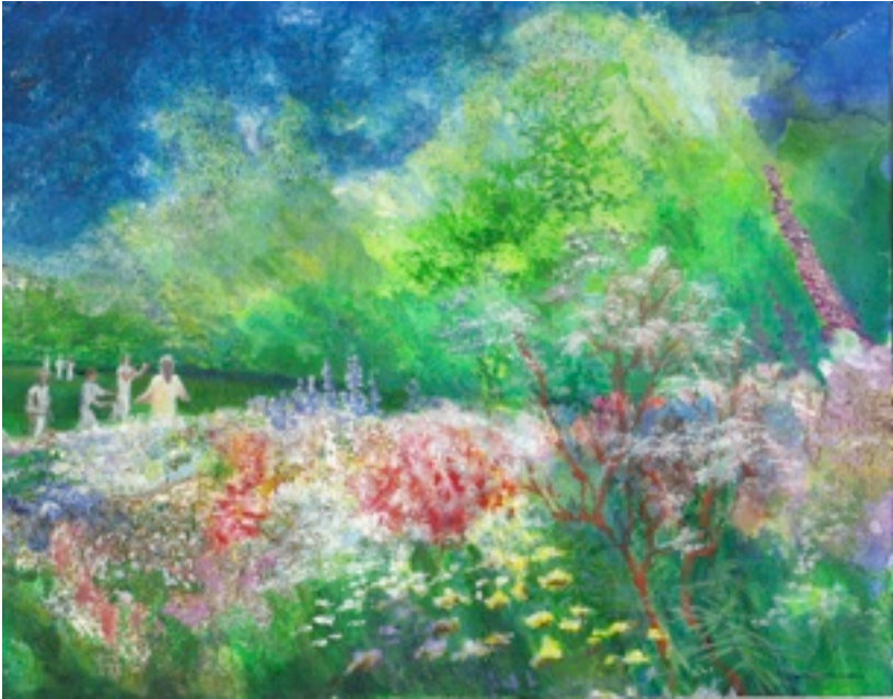
Jardin céleste (Acrylique sur papier, 30 x 21 cm)

encore, s'ils franchissaient cet obstacle ils entraient définitivement dans l'au-delà et n'allaient plus jamais revenir en arrière. D'autres experiencers disent avoir vu une immense et magnifique ville en or, aux pavés brillants d'une matière inconnue, et avec des pierres précieuses.