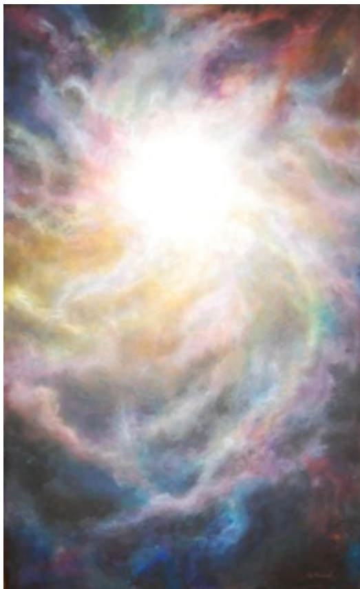
Lumière (Acrylique sur toile, 60x 100 cm)

Après être passé dans le monde spirituel la plupart de ceux qui racontent leur voyage dans l'au-delà disent avoir vu une lumière au milieu d'un environnement totalement noir. Parfois il s'agissait d'un minuscule point lumière. D'autres l'ont vu plus grande et d'autres encore se sont retrouvés dans un univers totalement noir, avec la conscience que